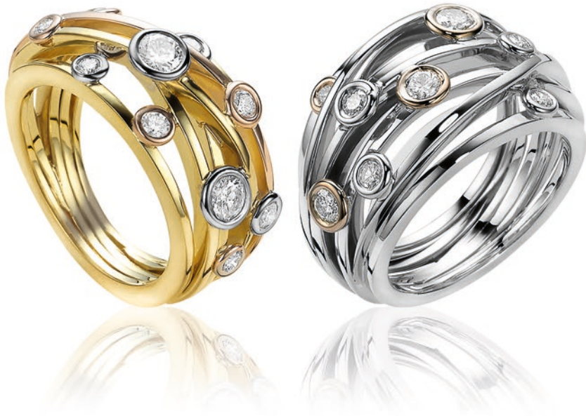
Ring in geel goud 18 kt. bezet met diamant Ring in wit goud 18 kt. bezet met diamant

Ring in yellow gold 18 kt. set with diamonds Ring in white gold 18 kt. set with diamonds